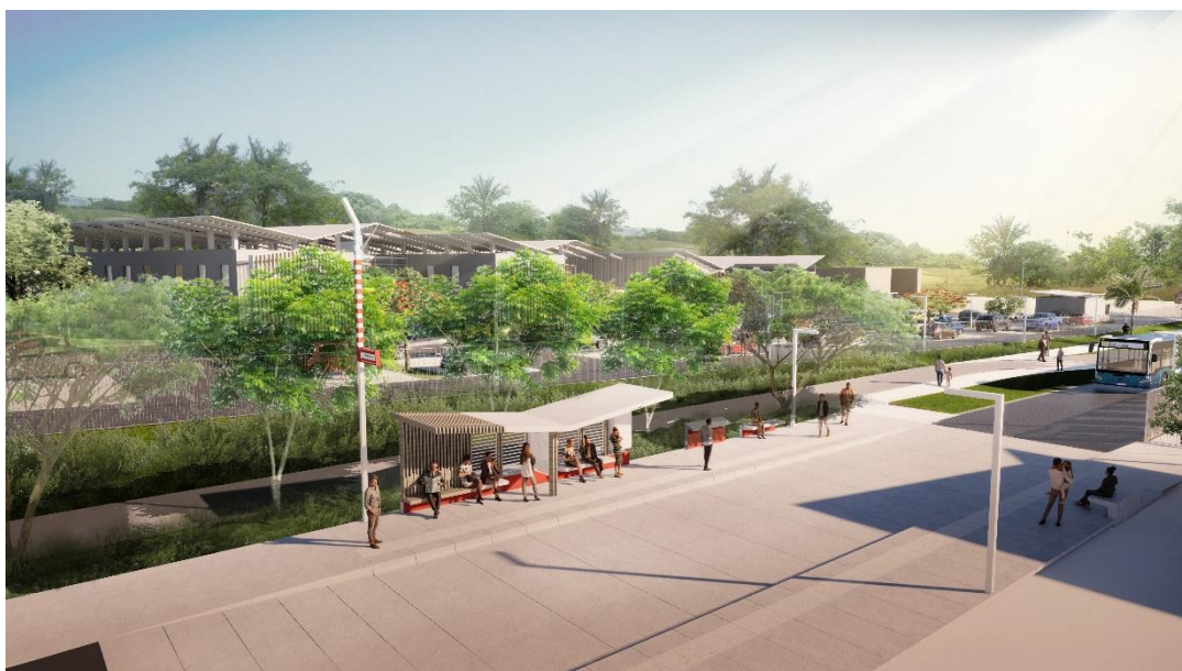
Maringouins – Station L Terminus (Ibys)