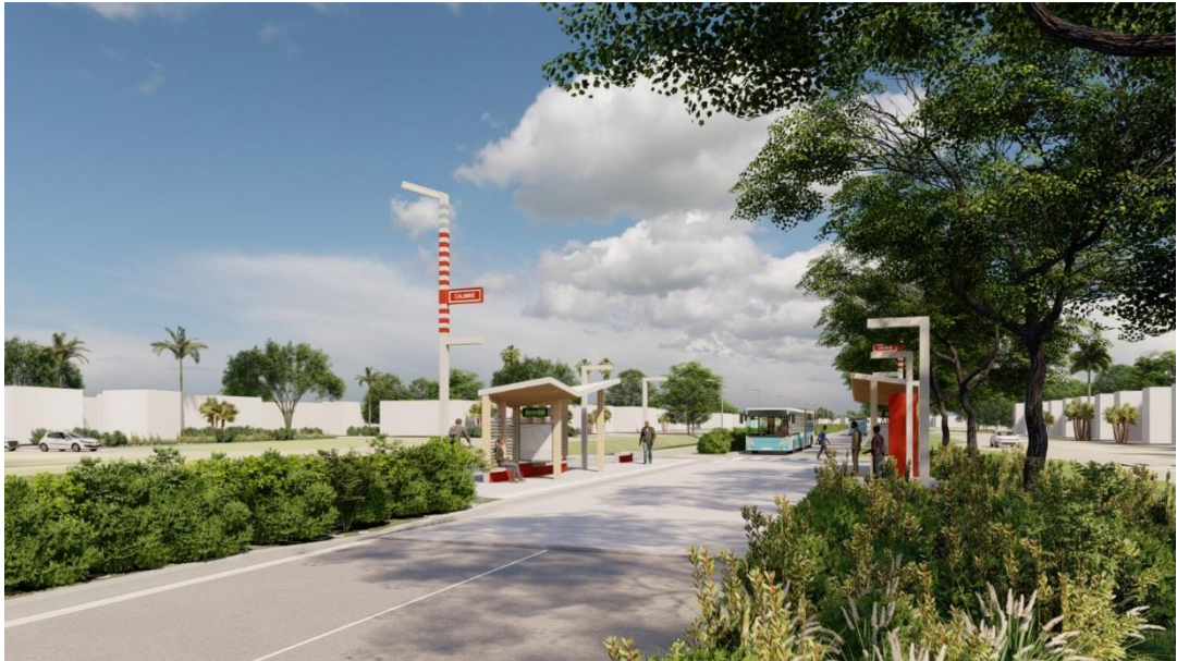
Calimbé – Station M (Ibys)

Des stations qui transforment le paysage