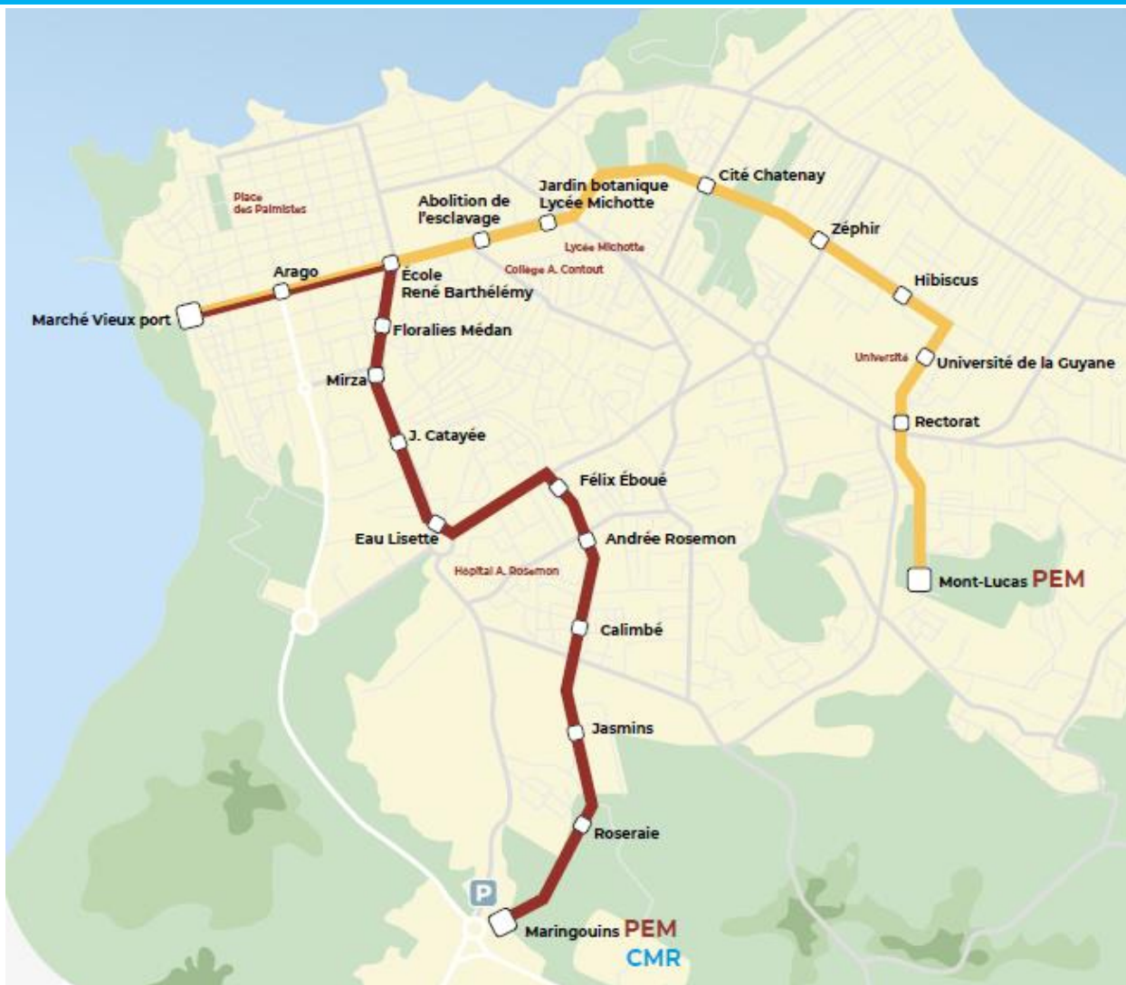
Tracé du TCSP (Ibys)

Le réseau de BHNS circulant sur cette infrastructure est constitué de 2 lignes (A et B) qui se retrouvent en tronç commun dans le centre-ville de Cayenne.