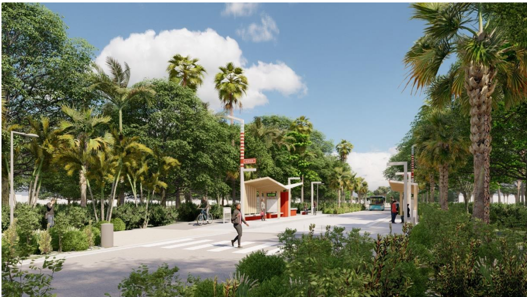
Roseraie – Station S (Ibys)