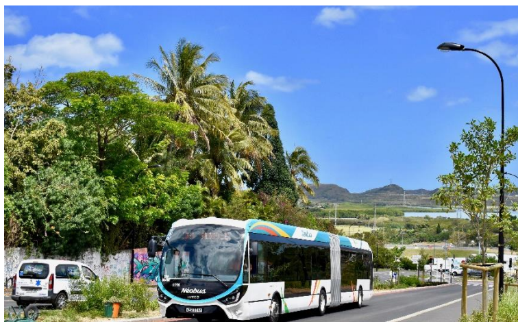
BHNS Néobus à Nouméa

Le bus est ici considéré dans sa conception la plus large. Il peut être guidé (guidage matériel ou immatériel) ou non guidé, à motorisation thermique, électrique ou hybride. (*sources : CERTU)