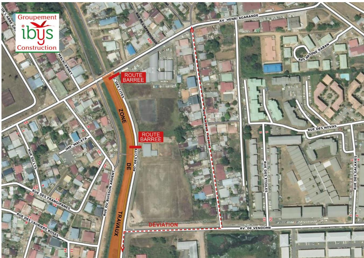
Secteur 2A - route barrée