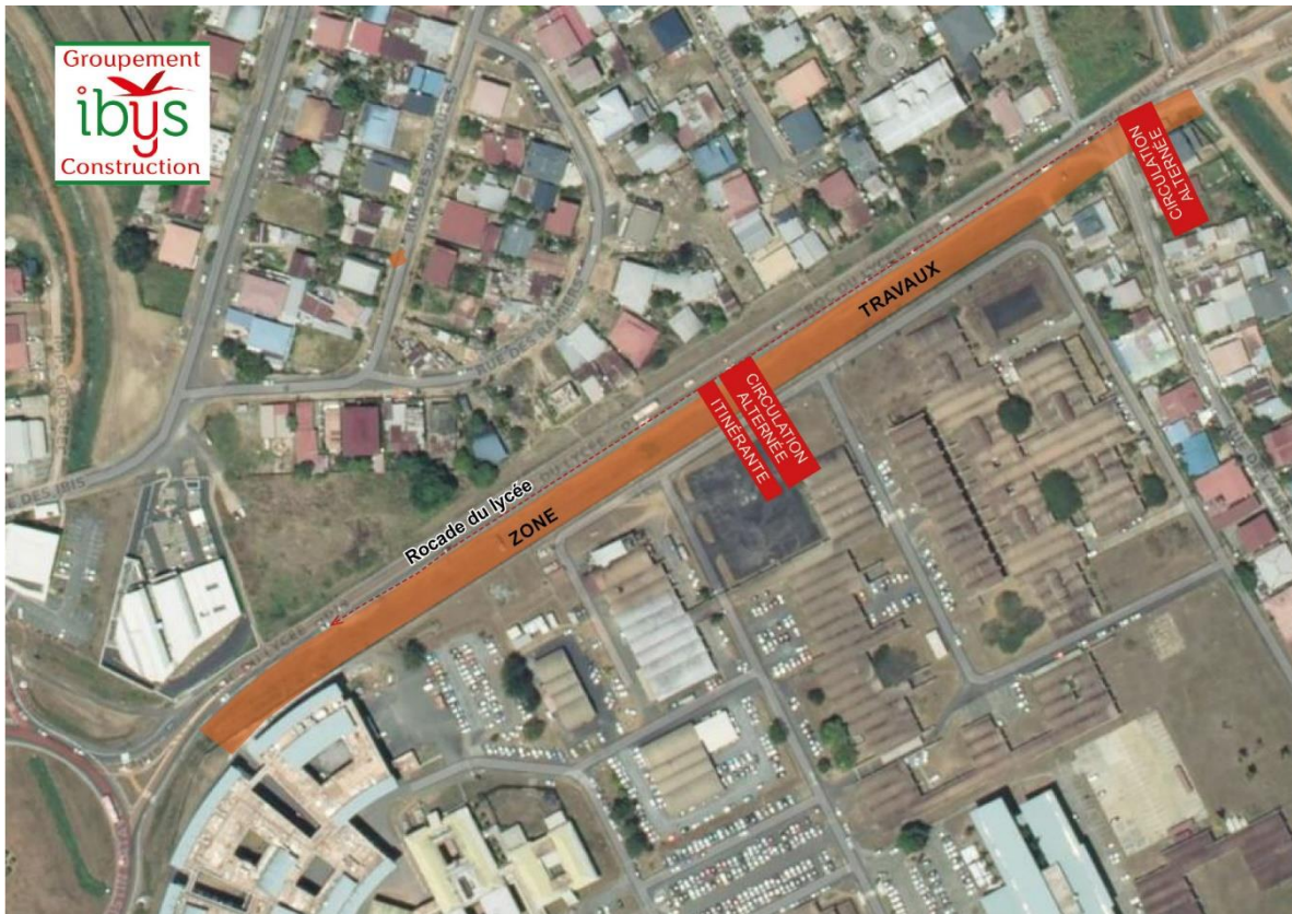
Secteur 2D – circulation alternée