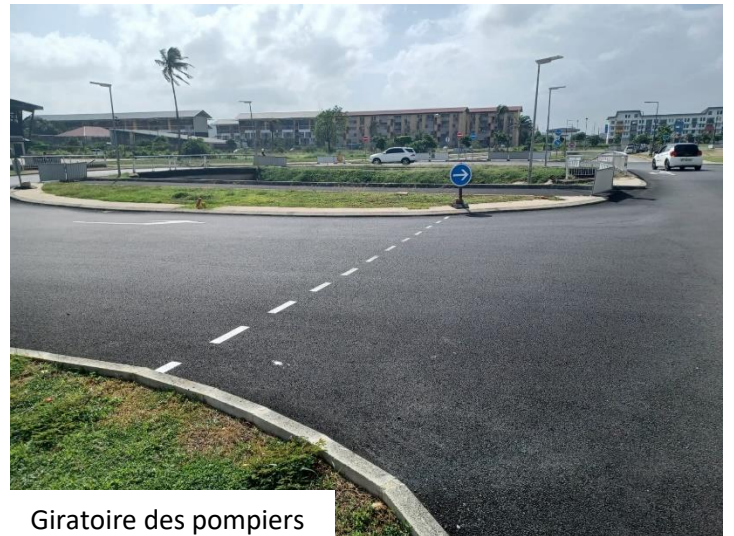
Giratoire des pompiers