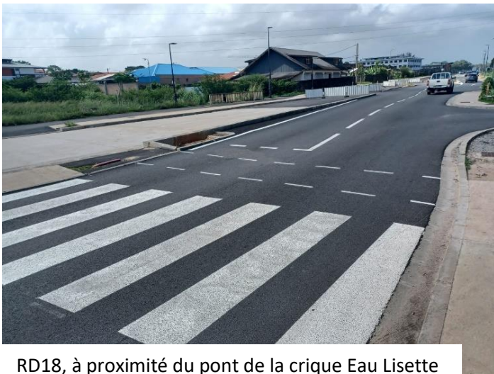
RD18, à proximité du pont de la crique Eau Lisette