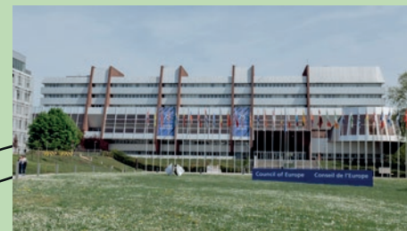
© Valentine Zeiler / Strasbourg Eurométropole